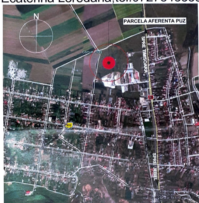
PLAN DE ÎNCADRARE IN GOOLE MAPS

PUBLICUL ESTE INVITAT SĂ TRANSMITĂ OBSERVAȚII asupra documentelor expuse sau disponibile la sediul Primăriei ȘAG, luni-vineri între orele 9-14, în termen de 15 zile