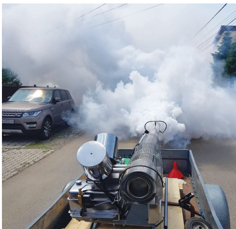
A început lupta cu insectele, în comuna noastră. Au fost realizate două

stropiri la sol, iar pentru ca efectul să fie de lungă durată, au fost urmate și de o stropire aeriană. Soluția folosită este avizată de Comisia Națională pentru produse biocide, din cadrul Ministerului Sănătății, și nu afectează sănătatea umană sau animală.