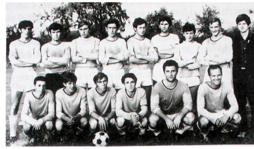
Echipa de fotbal între 1964 - 1970