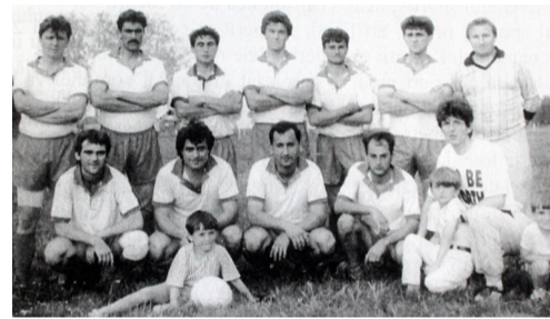
Echipa de fotbal în 1993