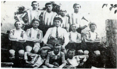
Echipa de fotbal în 1930

După 1990 echipa de fotbal se reorganizează și intră în subordinea Consiliului Local Șag iar din 2001 va purta numele C.S. Timișul Șag. În perioada 1993 – 1994 se construiește noul vestiar, în 2005 tribuna cu o capacitate de 60 de locuri, iar din 2013 terenul devine complex sportiv cu tribuna de 240 de scaune și trei loje, trei vestiare (gazde, oaspeți și arbi-