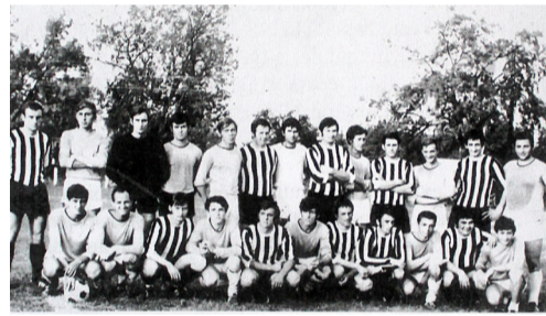
Echipa de fotbal între 1970 - 1980