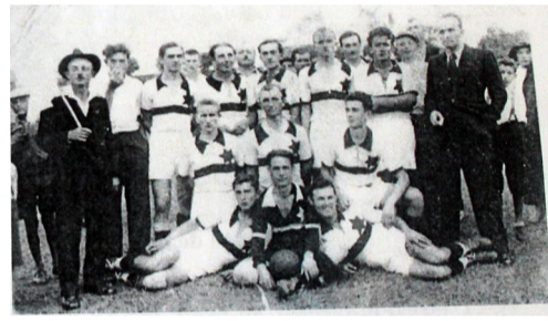
Echipa de fotbal în 1937