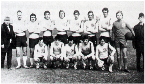
Echipa de fotbal între 1970 - 1980