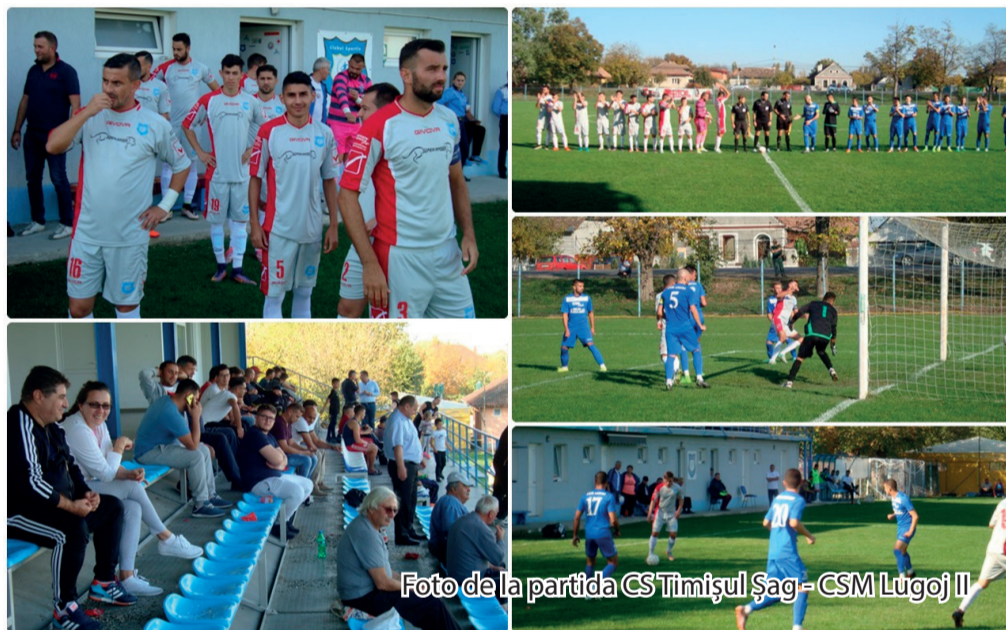
Foto de la partida CS Timișul Șag - CSM Lugoj II

După 13 etape, Timișul Șag înregistrează nu mai puțin de 11 victorii, un egal și o singură înfrângere,