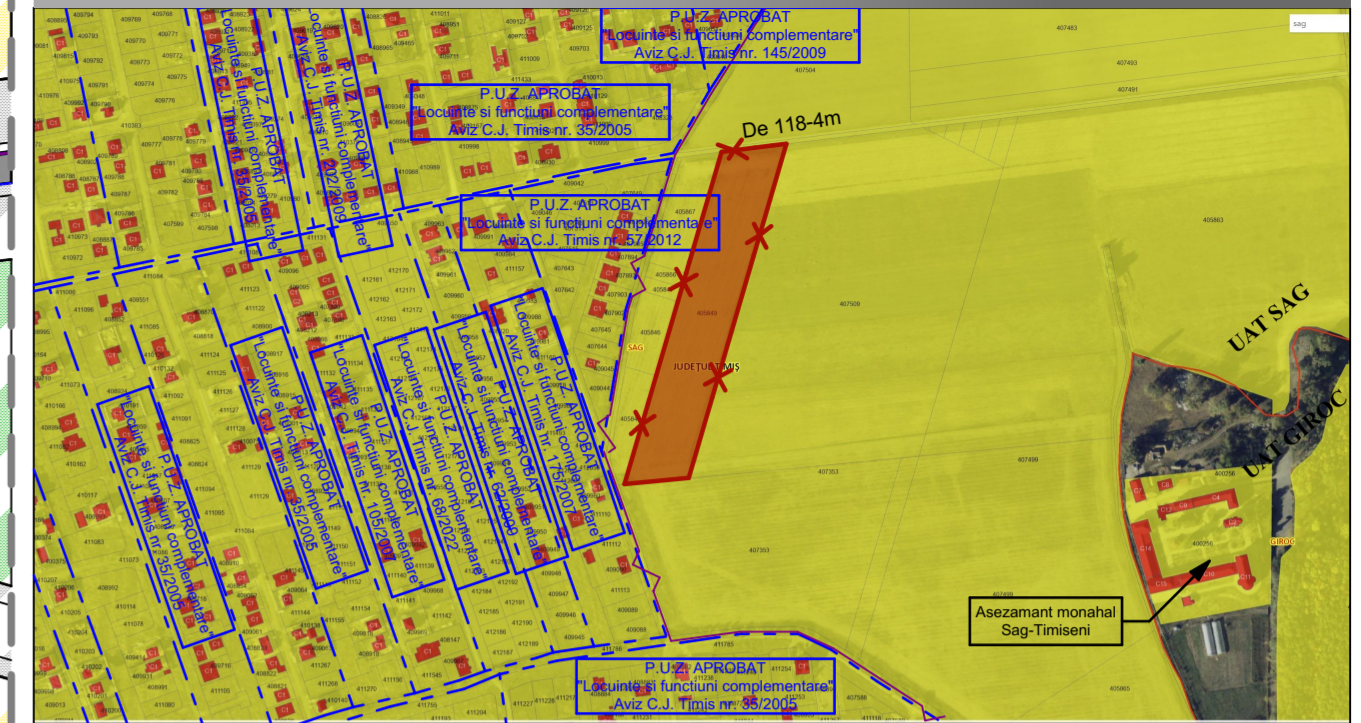
Plan de incadrare in zona sc. 1:10 000