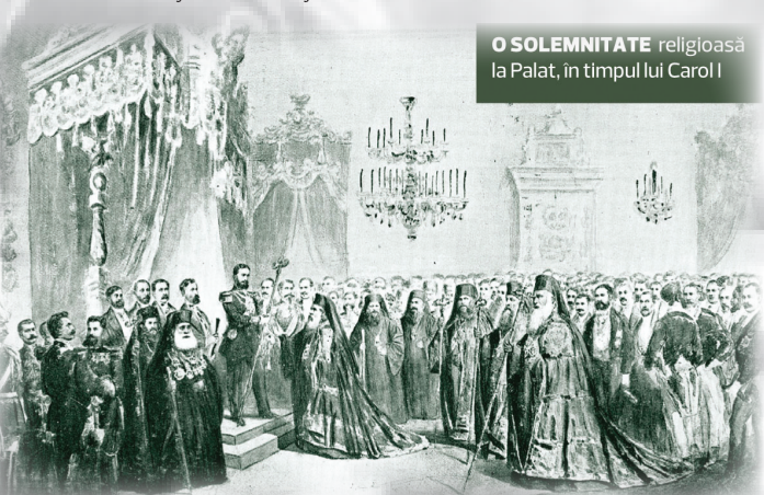
SOLEMNITATE religioasă la Palat, în timpul lui Carol I

În sâmbăta Paștelui, la 12 din noapte, regele urmat de Casa sa civilă și militară și escortat de un escadron de cavalerie