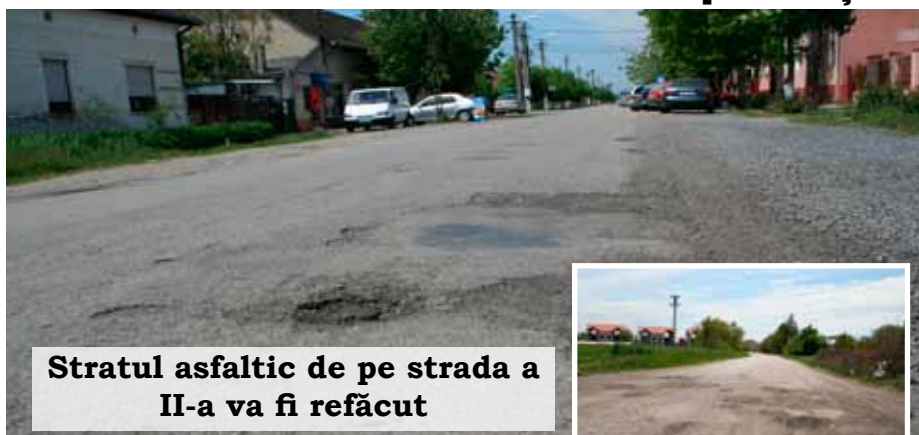
Stratul asfaltic de pe strada a II-a va fi refăcut